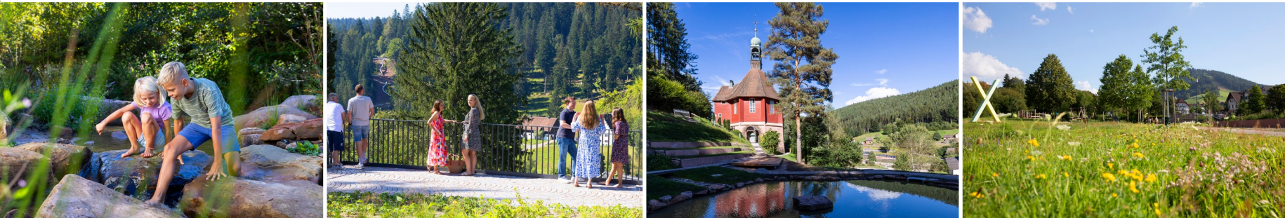
Blütenvielfalt und Lebensfreude entlang des Forbachs zwischen Freudenstadt (Bild unten), Christophstal, Friedrichstal und Baiersbronn